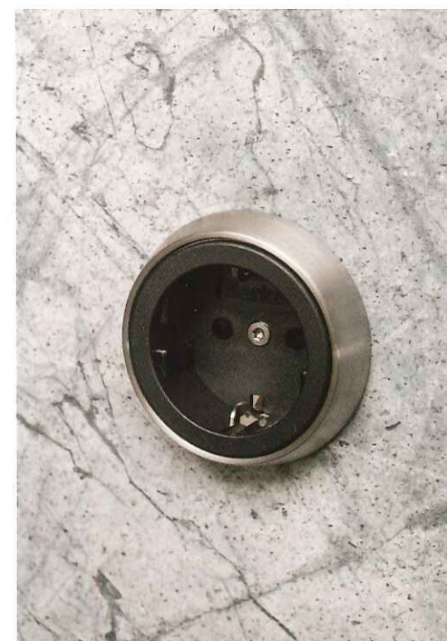
La prise de courant a été spécialement développée pour St-One.

bois massif a été utilisé pour l'aménagement intérieur des armoires et est disponible en Smoked Oak ou dans une version d'European Maple Oak claire. Des ferrures pour tiroirs développées par Strasser ont été intégrées dans le bois des tiroirs afin de pouvoir les régler avec beaucoup de précision. Les prises de courant ont également été créées par Strasser. Leur design a été assorti aux boutons de commande d'une table de cuisson Gaggenau. L'unité de l'îlot est préservée jusque dans l'évier qui a été parfaitement intégré au plan de travail pour que le dessin de la pierre soit préservé.