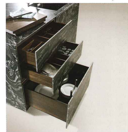
Les tiroirs en bois massif peuvent être dotés de divers compartiments.

"La pierre naturelle est un matériau idéal pour la cuisine", indique Strasser. "Elle n'est pas seulement résistante à la chaleur et aux griffes mais est aussi facile à entretenir et durable. Strasser veut par ailleurs toujours proposer une gamme up-to-date de coloris et de designs en suivant de près les tendances actuelles." Strasser a choisi quatre sortes de pierre différentes pour les îlots de cuisson St-One,