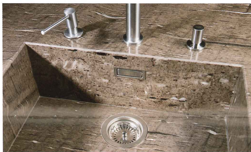
Le dessin de la pierre naturelle se prolonge jusque dans l'évier.

Si St-One a l'apparence d'une pierre robuste, la plinthe placée en retrait donne l'impression que l'îlot flotte au-dessus du sol et lui confère un aspect plus léger. Cet effet est renforcé si un éclairage led indirect est placé sur la plinthe.