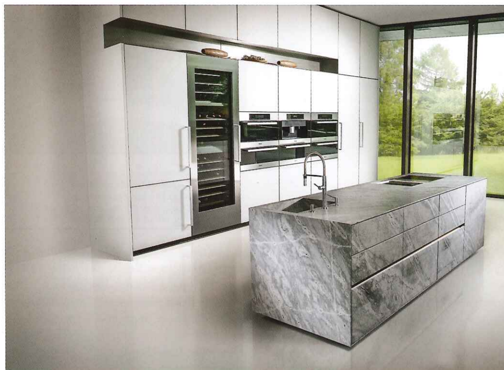
St-One Iceberg avec une finition Leather Look.

Le lancement de St-One à LivingKitchen a été précédé par plusieurs années de recherche, avons-nous appris. L'îlot de cuisson n'est donc pas seulement un élément design dans la cuisine. Même si St-One a l'apparence d'un bloc de pierre naturelle massif, les façades sont fabriquées en plaques de pierre de seulement 10 mm d'épaisseur. Les corps sont fabriqués en multiplex et sont bordés d'inoc. Du