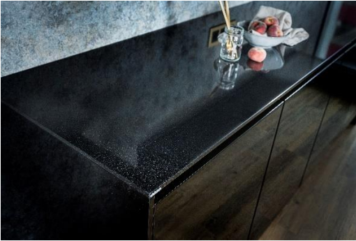
ALPINOVA in polierter Oberfläche – ein stylisches Statement.